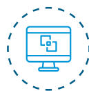
End To End Monitoring